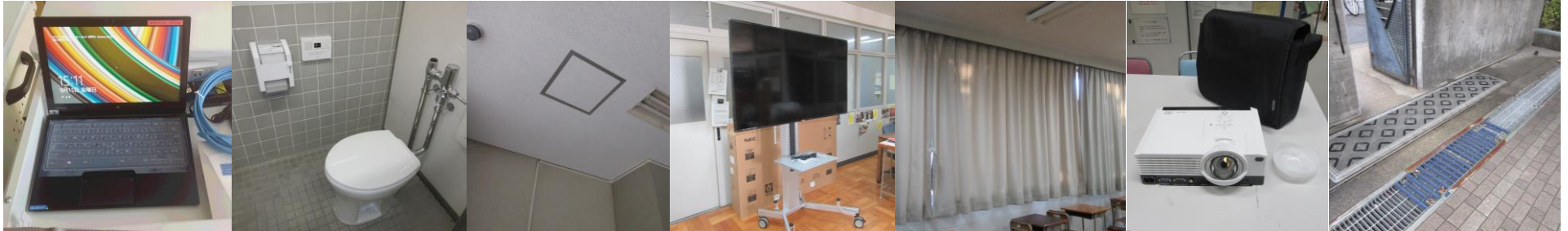
左から: 40台のタブレット端末を配備、四つのトイレを洋式化、生徒昇降口の天井を修繕、ワイドスクリーンモニターを図書室に設置、2年生の教室に遮光カーテンを新設、教室用プロジェクタを2台導入、正門のグレーチングに滑り止め加工を施工

生徒のための教育環境の改善に努めています。このことについて、どのようなご提案でもかまいませんので、いつでもご遠慮なくお申し出ください。