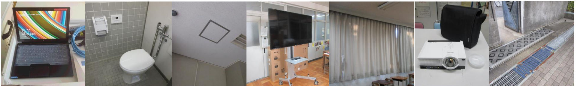
From left to right: 40 brand new tablet PCs added, 4 Western style toilets added, the ceiling of the entrance repaired, a widescreen monitor set in the library, new curtains for 11 th graders' classrooms set, 2 additional projectors for classrooms installed, nonskid processed gratings at the entrance to school

We continue making efforts to improve the school facilities for our students. Please feel free to tell us whatever good suggestions you have at any time.